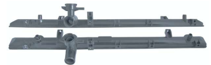
7758 / Sx4 1.5/1.6 07/09 Superior