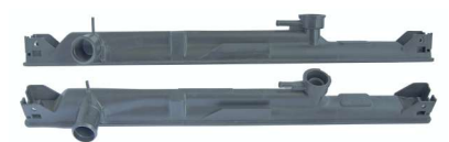
7799 / Vitara 01/05 Superior Lado Tampa