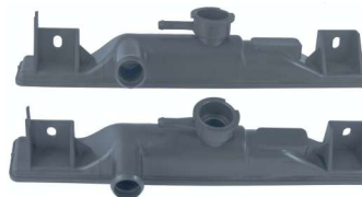
7757 / Swift 89/94 1.0/1.3 Superior