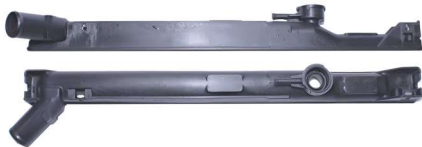
7193 / Tracker / Vitara 99 Mazda