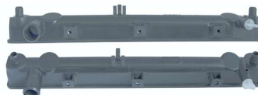
7760 / Jimmy 1.3 98/06 Inferior